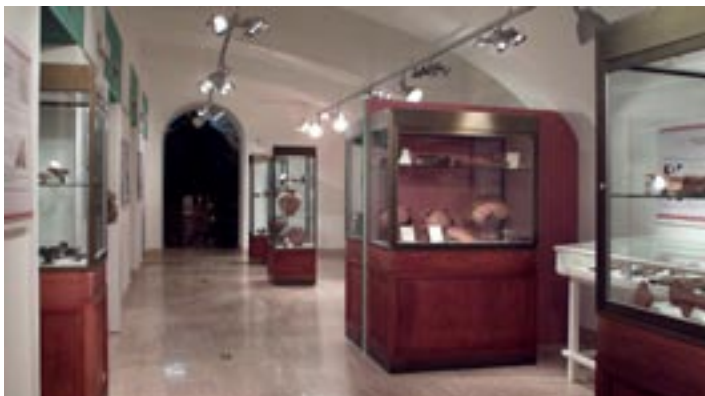
Fig. 2. Immagine della mostra "Dalla Capanna alla Casa" allestita nella Sala Orsini di Palazzo Chigi.