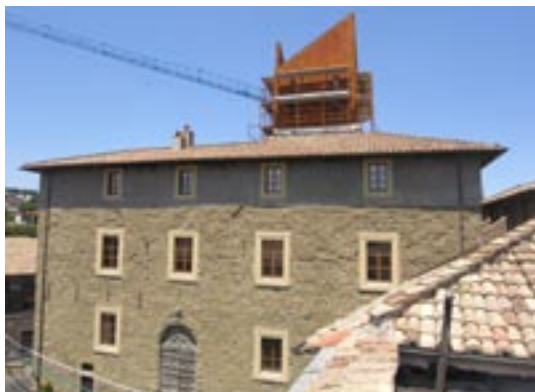
Fig. 1. Palazzo Chigi di Formello nel corso dei lavori di restauro.

del territorio, propedeutica alla visita delle sale museali, oppure il coronamento del giro del palazzo.