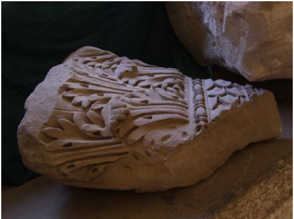
Fig. 2. Capitello ionico della serie 2