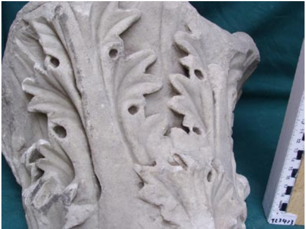
Fig. 1. Capitello ionico della serie 1