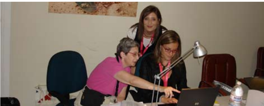
Collaboratori e volontari negli stands del Congresso e di Fasti Online e nella segreteria del Congresso.