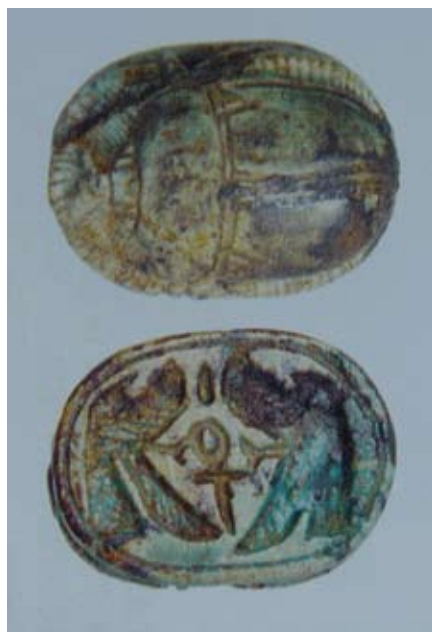
Fig. 1) da A. M. Moretti Sgubini, Scavo nello scavo, Viterbo 2004 , pp. 128-149.

Gli esemplari considerati sono più numerosi rispetto a quelli esaminati dal Gorton pur