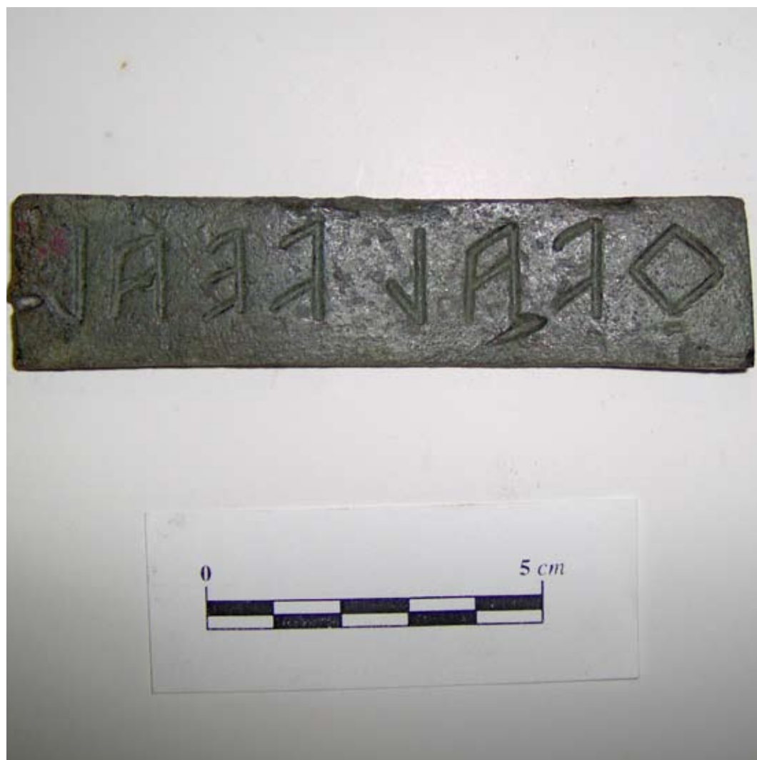
Laminetta bronzea con iscrizione a Vei da Orvieto/Cannicella

Il problema dell'introduzione di elementi di culti greci sul sostrato indigeno è sempre stato interesse di molti studiosi. Sul piano dei culti ctoni, esso è balzato alla luce sin da quando, nel porto-emporio di Tarquinia, Gravisca, nei pressi di un edificio menzionato come l'edificio beta, negli anni '70 del Novecento, è stata rinvenuta ceramica attica iscritta, menzionante sia la greca Demetra, sia la etrusca Vei in connessione con oggetti votivi chiaramente afferenti alla sfera demetriaca (Fiorini 2005). La divinità Vei è stata pertanto ipotizzata anche in un santuario piuttosto particolare, localizzato all'interno delle mura della città di Veio, laddove il culto si svolgeva in un edificio coperto con accanto un recinto ipetrale (Carosi 2002). Da questo santuario derivano teste e statuette soprattutto femminili che nelle tipologie più antiche trovano confronti nell'area magno-greca, in particolare locrese; inoltre, tra le statuette, alcune sono del tipo di offerente con il porcellino di produzione tipicamente geloa (480-470 a.C.) (Comella-Stefani 1990). Questo elemento, che indirizza nel senso di una religione di "tipo demetriaco" è inoltre seguito, in epoca più recente (IV sec. a.C.) dalla presenza di un bronzetto raffigurante un'offerente femminile con cinghialetto e da una piccola olpe di argilla depurata acroma che riporta un'iscrizione, incisa dopo la cottura, menzionante un "L. Tolonios" autore della dedica a "Cerere".