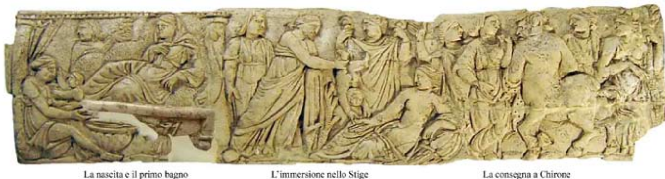
La nascita e il primo bagno