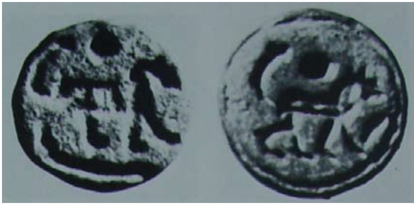
Fig. 2) da Hölbl 1979, II, tav. 70, 1-2

che l'impianto delle prime manifatture si dovrebbe collocare attorno al 620 a.C., GORTON 1996) e l'arcaico della prima metà del VI sec. a.C. La consistenza del numero è dovuta al fatto che quasi tutti gli scarabei provengono dai santuari di Satricum e del Portonaccio di Veio, gli unici che hanno restituito in Italia quantità considerevoli di scarabei, paragonabili a quelle dei santuari di area greca peninsulare e insulare. Proprio il fatto che gli scarabei si ritrovino in determinati contesti, dapprima in tombe di donne e bambini e successivamente anche in aree sacre illustra quanto significativamente profonda sia stata la ricezione del manufatto e della simbologia sottesa, e che essa sia perdurata, a differenza del mondo greco, dato che la gemma a scarabeo venne sostituita da quella piano - convessa già a partire dalla prima metà del V a.C.